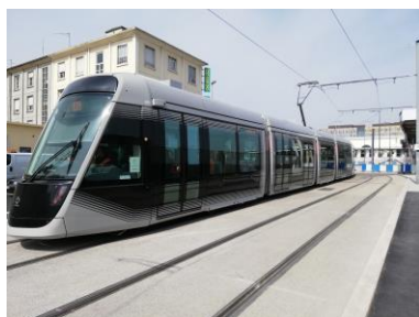
Le Citadis 305 de Caen durant la période d'essais

Bien sûr, notre propos premier est de parler « cars et bus » à travers notre lettre d'infos, mais, une fois n'est pas coutume, on ne pourra s'empêcher de penser que les passionnés de transports en commun regardent les véhicules ferroviaires avec le même intérêt que les véhicules routiers. Et puis, dès qu'il s'agit de Caen, n'est-ce pas ? Comme la presse l'a annoncé en avril dernier, c'est le samedi 27 juillet que sera inauguré le tram de Caen, de type Alstom Citadis 305, tout comme le nouveau réseau d'autobus Twisto. Une date importante dans l'histoire de la ville qui souhaite définitivement tourner la page du TVR, dont les déboires ont fait couler beaucoup d'encre. Car-Histo-Bus n'organise rien d'officiel ce jour-là, mais les personnes désireuses de se rendre à cet événement peuvent se rapprocher de notre association, via son Président, pour que des rencontres entre adhérents puissent se mettre en place, même si la foule promet d'être dense !