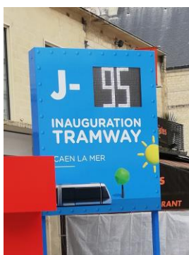
Le compte à rebours a commencé...