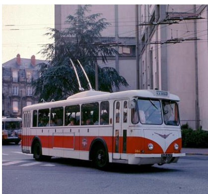
Le 264 en service à Limoges en mai 1988, quelques mois avant sa réforme