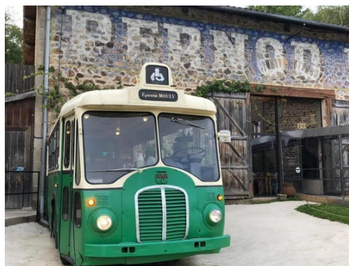
Oui, cet OP5 parisien fait bien partie du paysage limougeaud !

Nombre de nos adhérents nous demandent ce qu'il en est de la préparation de notre Assemblée Générale 2021, prévue à Limoges, du 26 au 28 mars. Pour l'heure, celle-ci est toujours maintenue, selon le programme défini dans notre Lettre d'informations n° 46. Mais, bien entendu, nous restons soumis aux directives gouvernementales qui pourront varier en fonction de l'évolution de la situation sanitaire. Notre conseil ? Réservez votre train dans les meilleurs délais ! Si annulation il devait y avoir, la SNCF se chargerait de rembourser les frais avancés, comme l'an dernier. En ce qui concerne l'hôtellerie, des informations précises lors de notre prochaine Lettre, à paraître à la mi-février, et via notre site Internet : www.car-histo-bus.org