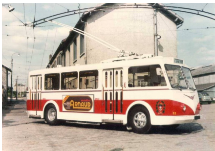
Décidément, Limoges et Vétra demeurent des mythes pour nous autres...