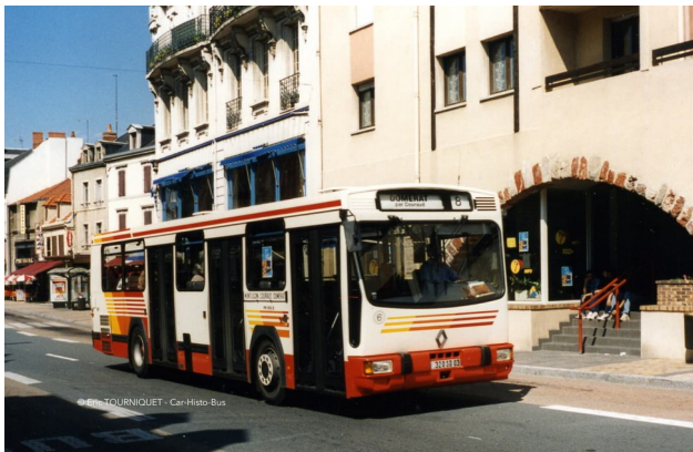
Un Renault PR 100.2 sur la ligne 3 de l'ancien réseau de Montluçon, dans l'Allier (03), pour symboliser le 3 e jour des restrictions de déplacement.

Voir ci-dessous les adresses de nos différentes pages.