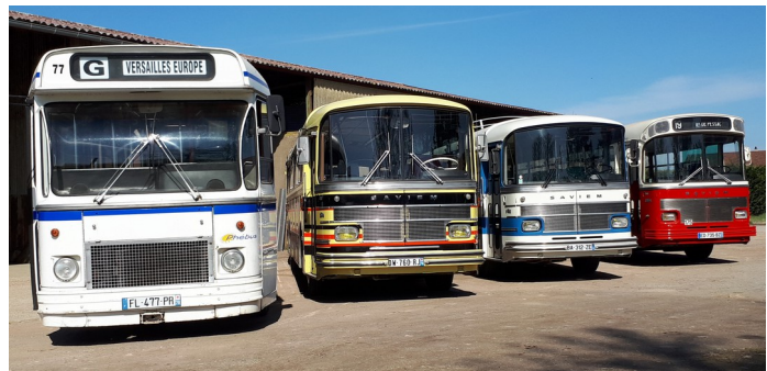
24 mars 2021 : tenue de l'Assemblée Générale de Saviem Passion. A cette occasion, sortie de véhicules emblématiques de notre patrimoine commun...